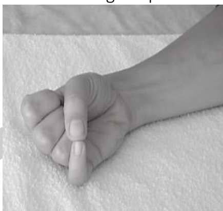
Mudra de Boot up

🌀 INFORMACIÓN ESCONDIDA Hay alguna información escondida que no nos permite realizar el testaje o que nos interfiere en la respuesta.