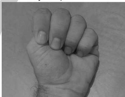
Mudra de Información escondida

🌀 INFORMACIÓN ESCONDIDA Hay alguna información escondida que no nos permite realizar el testaje o que nos interfiere en la respuesta.